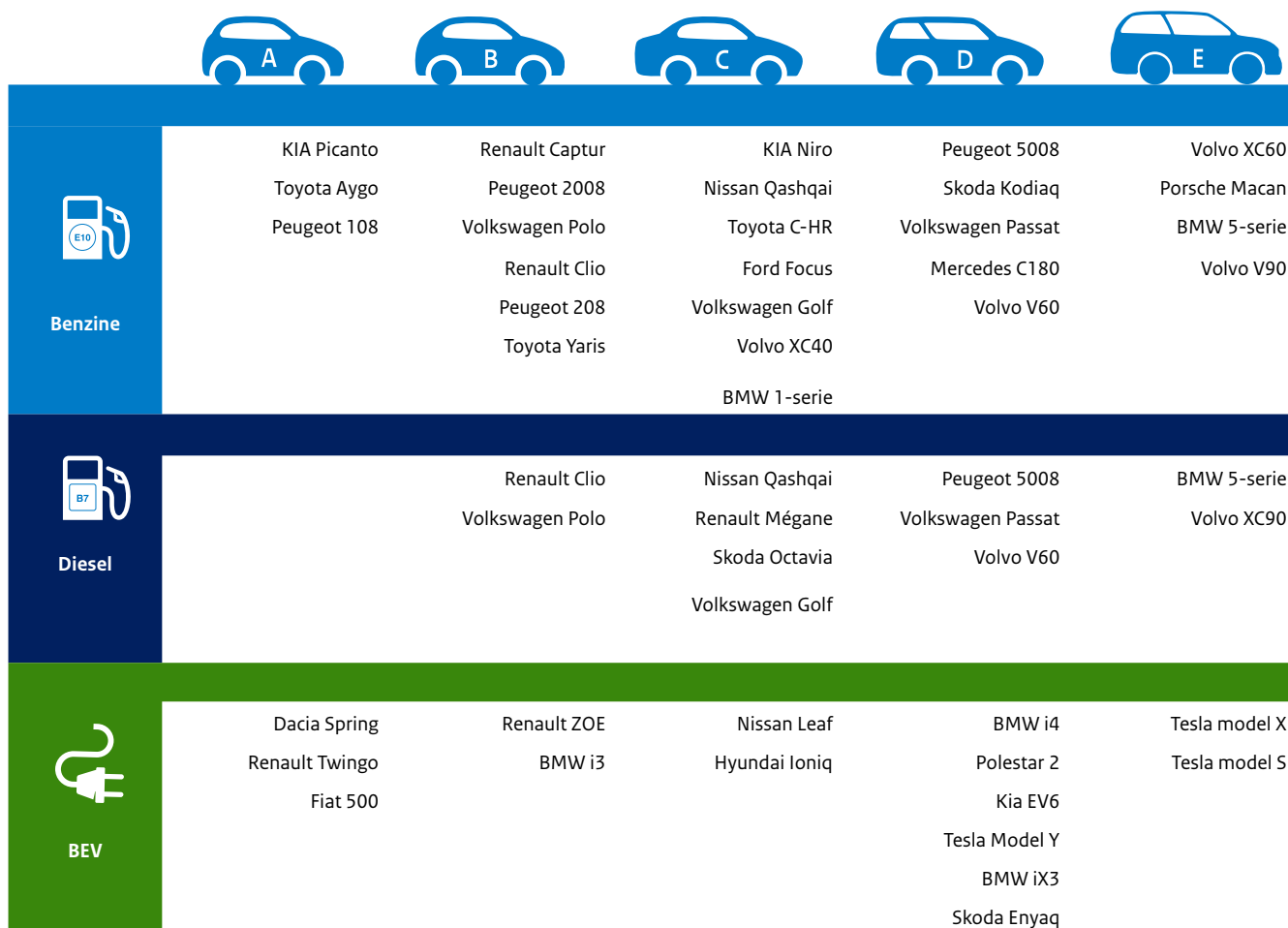
Tabel 1: Voorbeeldauto's per segment

en meetbare benadering voor het indelen van voertuigen in segmenten en sluit, op enkele uitzonderingen na, goed aan bij de auto's die de markt (zowel consumenten als producenten) herkent als typisch voor het betreffende segment. De totale markt is ingedeeld in de segmenten A tot en met E (A=klein, B=compact, C=kleine middenklasse, D=grote middenklasse, E=groot, luxe en duur). Deze segmentindeling wordt tevens gebruikt door de Rijksdienst voor Ondernemend Nederland (RVO) en het Ministerie van IenW om marktontwikkelingen te monitoren, beleidseffecten te evalueren en verschillen tussen vergelijkbare brandstofauto's en nulmissie auto's te kunnen analyseren. Belangrijke voertuig- en kostenkenmerken die als input dienen voor TCO-berekeningen kunnen op het bovengenoemde niveau 1 gebaseerd worden op verkooptgemiddelden van de totale nieuwverkoop per segment of op basis van "mandjes" van geselecteerde auto's die representatief zijn voor een segment. In de tabel hieronder staan een aantal voorbeeldauto's per segment.